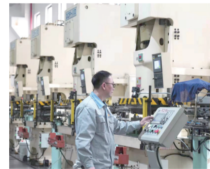
位于水土园区的重庆嘉泰罗光电科技有限公司