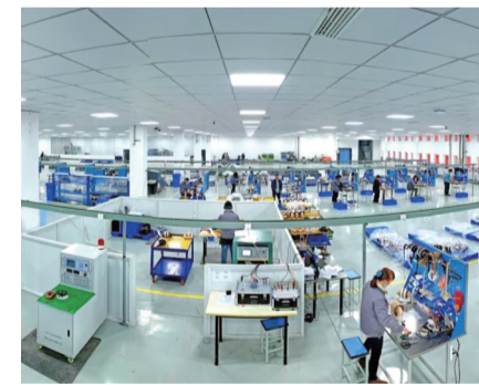
位于西部(重庆)科学城北碚园区的重庆华虹仪表有限公司智能电网电能计量产业基地

下一步，北碚将持续实施市场主体培育计划，加大民营“四上”企业培育力度，持续支持民营企业建设数字化车间和智能工厂，引导服务民营企业“专精特新”发展。