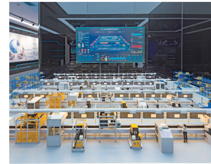
位于两江蔡家智慧新城的工业互联网生态园展览馆