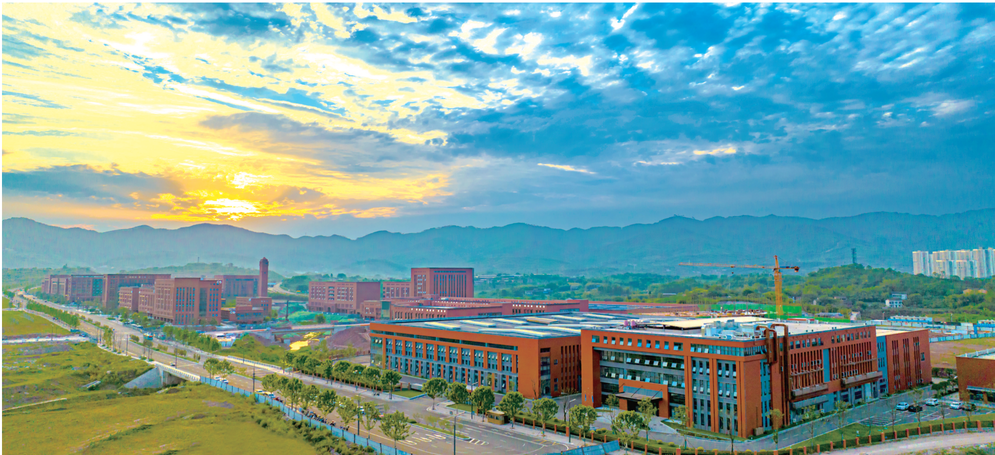
西部(重庆)科学城北碚园区

越是攻坚时期，越要善作善成。北碚正聚焦聚力、攻坚突破，坚定不移抓工业、坚定不移抓项目、坚定不移抓市场，坚决打好这场实打实、硬碰硬的经济攻坚战，用“拼搏指数”换“增长指数”。