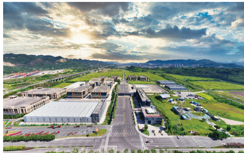
国家级开放平台——江津综合保税区

据了解,此次活动不是第一次向新加坡宣传江津,随着西部陆海新通道的应运而生,江津借势“东风”,搭乘“快车”,多次出访包括新加坡在内的东南亚国家,建立深厚友谊,促进经贸交流,推动江津与世界共舞,与时代同行。