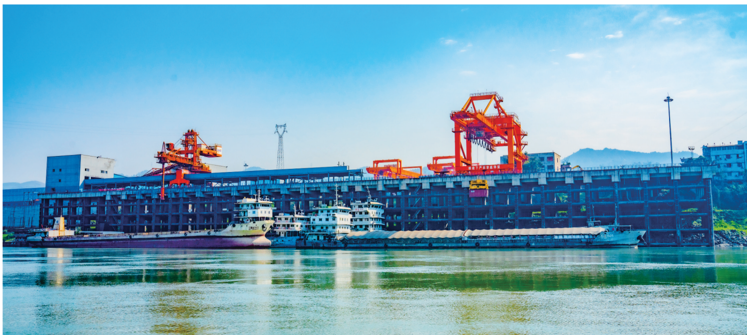
江津将致力于发挥好西部陆海新通道重庆主枢纽功能,抓住中新(重庆)战略性互联互通示范项目契机共谋发展、共创未来。图为珞璜港