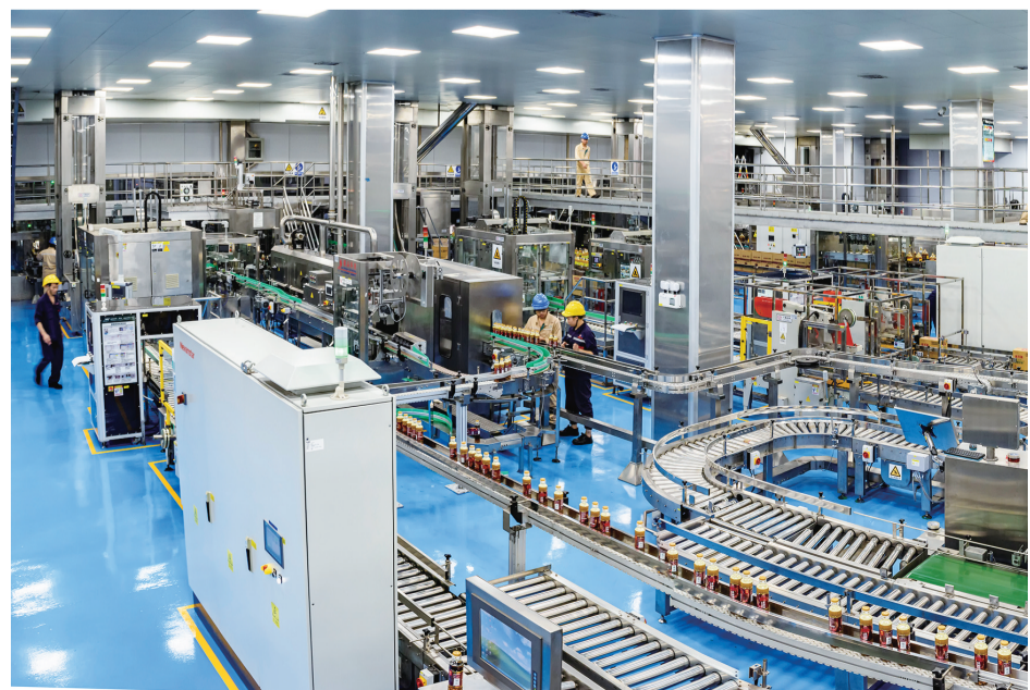
位于德感工业园的新加坡丰益集团旗下的益海嘉里智能工厂,实现了从“入库”到“出库”全线智能化管控