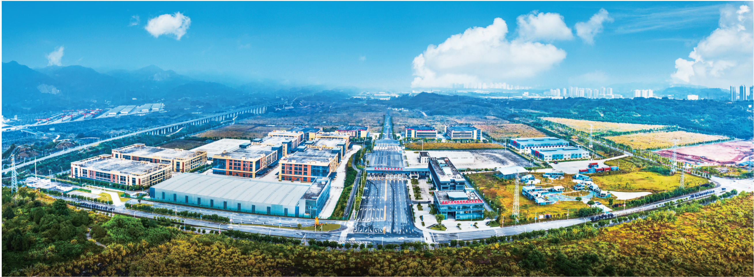
江津推动“通道+经贸+产业”联动发展,加快建设在全国有影响力的内陆开放前沿和陆港型国家物流枢纽